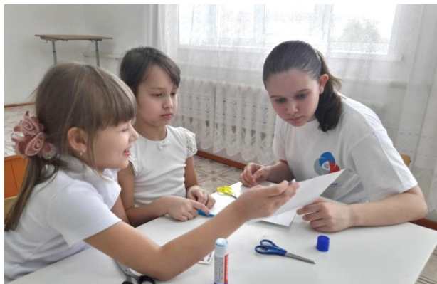
Акция РДШ «Эстафета добра», посвященная годовщине воссоединения Крыма с Россией