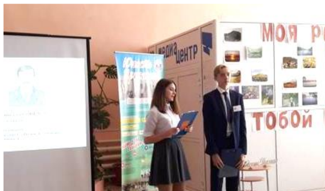
Слет лидеров районной ДОО «Юность Присяянья»