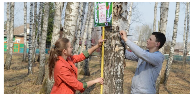
Экологический отряд «Зеленый патруль»