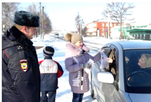
Акция ЮИД «Светофор»

Любознательность Инициативность Настойчивость Способность адаптироваться Лидерские качества Социальная и культурная грамотность