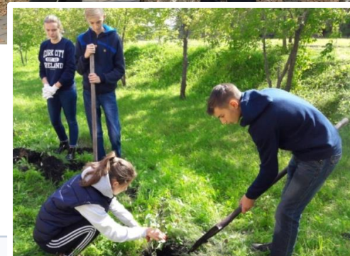
Социальный проект «Аллея выпускников»