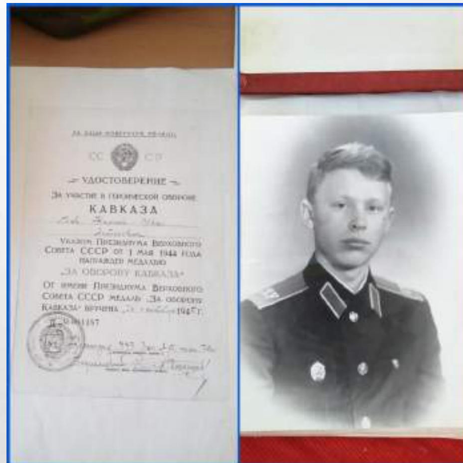
Выставка «Армейский чемоданчик»