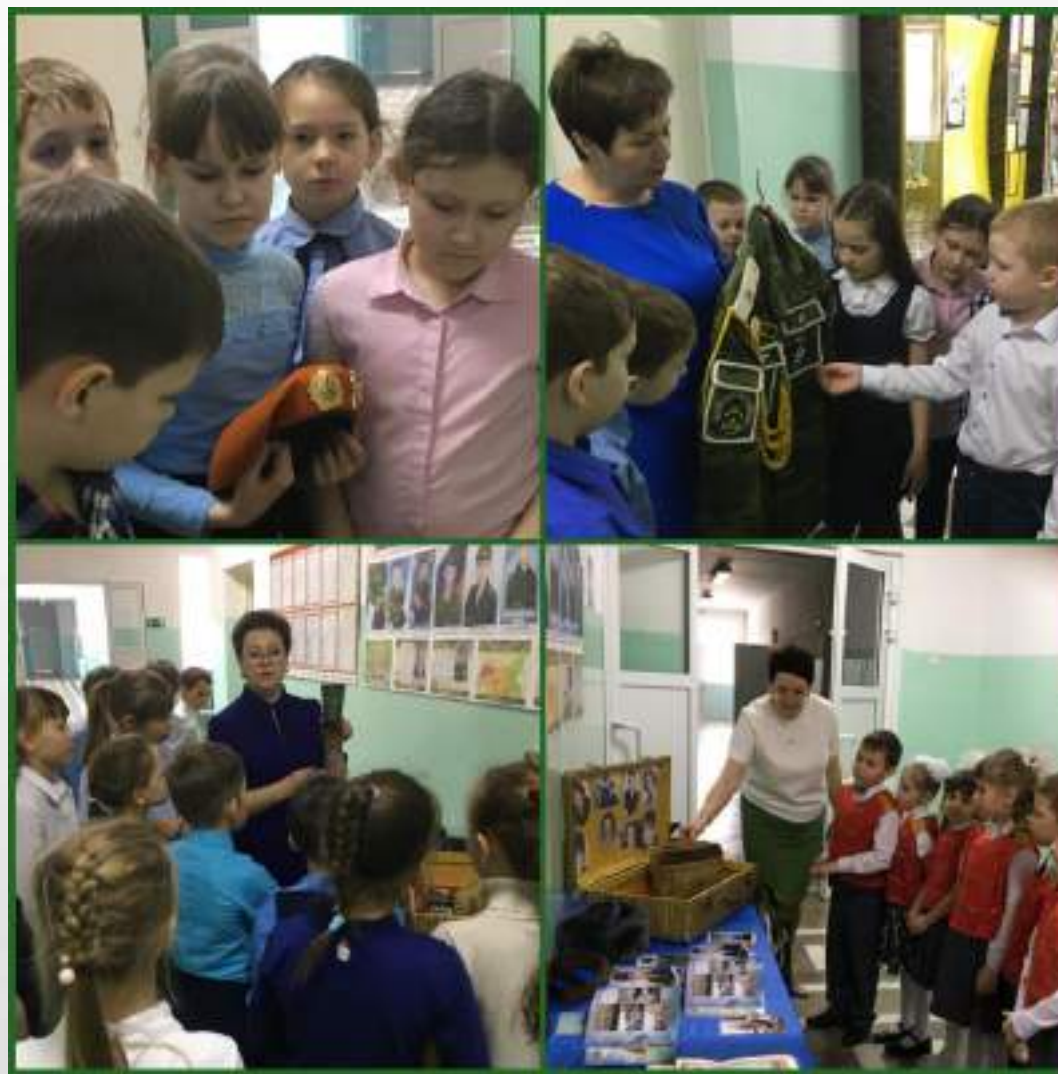
Выставка «Армейский чемоданчик»