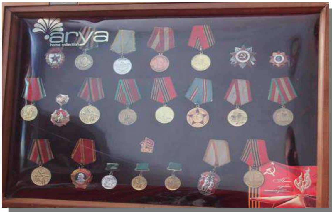
Награды моего прадеда