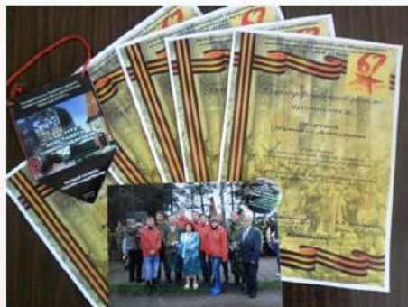
Всероссийская вахта памяти Проведение полевых поисковых работ на местах боевых действий Великой Отечественной войны в Тверской области