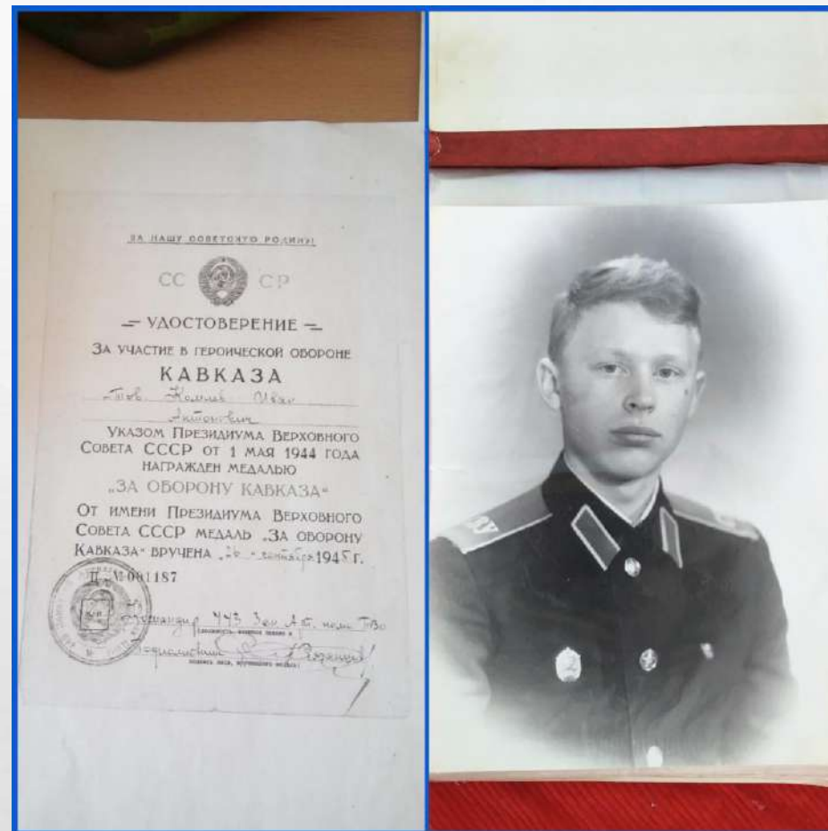
Выставка «Армейский чемоданчик»