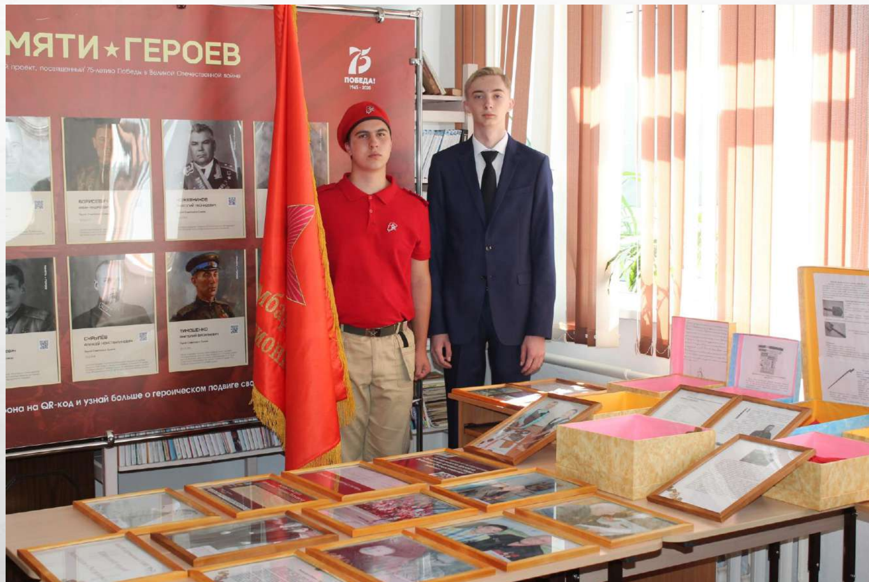
Передача дубликата знамени 30 бомбардировочного авиационного полка на хранение